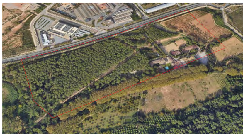
Figura 1. Àmbit del Projecte.

Ens situem doncs a l'espai que hi ha entre la BP-1413 i la Riera de Sant Cugat, a l'alçada de Can Costa. Es tracta d'un àmbit que ha estat de titularitat privada fins la seva adquisició per a la reparcel·lació del sector. L'objectiu ara es el d'ordenar els espais públics generant els vials definits al POU per tal de donar accés a les noves parcel·les.